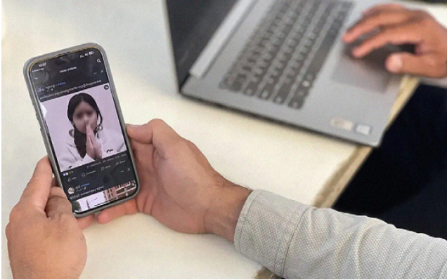
ក្មេងស្រីកម្ពុជាដែលត្រូវបានគេជួញដូរទៅប្រទេសចិន បានបង្ហោះវីដេអូនៅលើបណ្តាញផ្សព្វផ្សាយសង្គមដើម្បីស្នើសុំជំនួយ។

ស្រ្តីជាច្រើននៅក្នុងប្រទេសកម្ពុជាសម្រេចចិត្តធ្វើតាមឈ្មួញកណ្តាល បន្ទាប់ពីបានឮការសន្យាផ្តល់ប្រាក់ ឬការជួយទ្រទ្រង់ដល់គ្រួសាររបស់ពួកគេ។ ស្រ្តីមួយចំនួនក៏អាចនឹងទៅធ្វើការនៅក្នុងរោងចក្រឬត្រូវបានគេកេងប្រវ័ញ្ចផ្លូវភេទដើម្បីសងបំណុលដំបូងរបស់ពួកគេ។ ២២