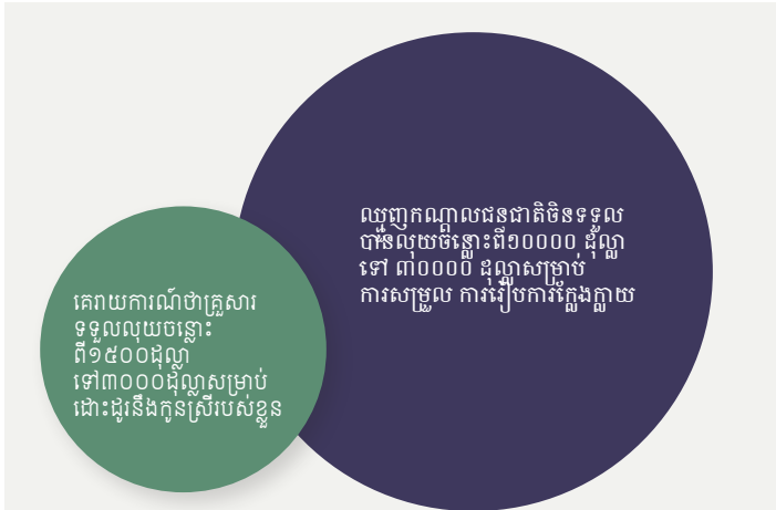
រូបភាព ៤ វិធីដែលឈ្មួញកណ្តាលទទួលបានប្រាក់ចំណេញពីការជួញដូរ

នៅកម្ពុជា អង្គការមិនមែនរដ្ឋាភិបាល បានដើរតួនាទីយ៉ាងសំខាន់ជាយូរមកហើយក្នុងការផ្តល់កន្លែងស្នាក់នៅ ជំនួយផ្លូវចិត្ត ជំនួយផ្នែកច្បាប់ និងកម្មវិធីសមាហរណកម្ម។ ពួកគេ ក៏ធ្វើការងារបង្ការនានា ដូចជាយុទ្ធនាការលើកកម្ពស់ការយល់ដឹងជាដើម។