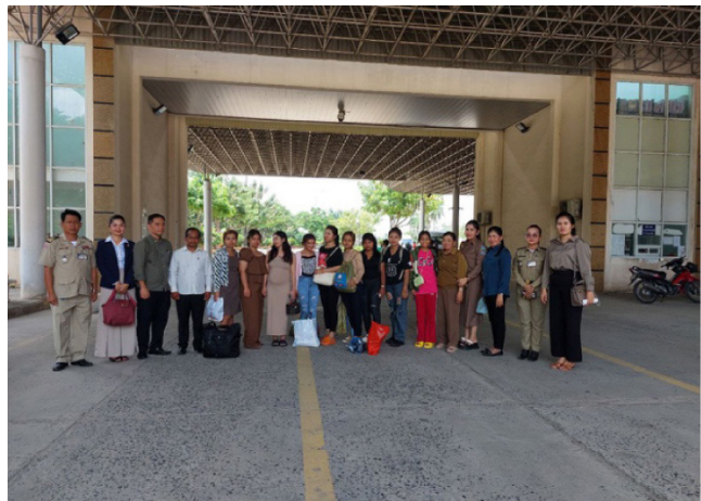
ស្ត្រីកម្ពុជាដែលត្រូវបានគេជួញដូរ ត្រូវបានស្នាក់នៅនៅព្រំដែនវៀតណាម ខណៈជនល្មើសស្វែងរកផ្លូវដែលគេមិនសូវចាប់អារម្មណ៍។

គួយដឹង ជនជួញដូរ ត្រូវបានគេរាយការណ៍ថាកំពុងផ្ដោតកាន់តែខ្លាំងឡើងលើស្ត្រីនៅទីក្រុង - ជាពិសេសកម្មការិនីកាត់ដេរនិងបុគ្គលិកកាដេនីយដ្ឋាន ជាជាងស្ត្រីដែលមកពីសហគមន៍ជនបទដែលយល់ដឹងពីហានិភ័យ។ ៧៩ ឧស្សាហកម្មវាយនភណ្ឌនិងស្បែកជើងរបស់ប្រទេសកម្ពុជា មានកម្មករមួយលាននាក់ ដែល ៧៥ ភាគរយជាស្ត្រីមកពីទីជនបទ។ ប្រាក់ឈ្នួលទាប កិច្ចសន្យាការងារមិនប្រកបដោយលទ្ធភាព និងបំណុលគ្រួសារច្រើន ធ្វើឱ្យពួកគេងាយរងគ្រោះជាពិសេសចំពោះអ្នកជួញដូរដែលធ្វើពុតជាមិត្តភក្តិឬដៃគូស្នេហា ដោយប្រើការកសាងទំនុកចិត្តបន្តិចម្តងៗ មុនពេលអូសទាញពួកគេឱ្យធ្វើចំណាកស្រុកទៅប្រទេសចិន។ លើសពីនេះ អង្គការមិនមែនរដ្ឋាភិបាល បានព្រមានថាបន្ទាប់ពីការកើនឡើងនៃជម្លោះព្រំដែនរវាងប្រទេសថៃនិងកម្ពុជាក្នុងឆ្នាំ២០២៥ និងការរើសអើងប្រមូលប្រាក់កម្មជាវិញជាបន្តបន្ទាប់របស់ពលករចំណាកស្រុករាប់រយរាប់ពាន់នាក់ ស្ត្រីជាច្រើនទៀតទំនងជាងាយរងគ្រោះពីអ្នកជួញដូរ នាពេលអនាគត។