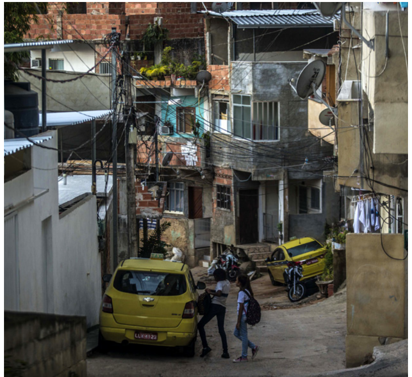
Milicias respaldadas por la Policía dominan actualmente muchas de las principales ciudades de Brasil, incluida Río de Janeiro, donde controlan a un tercio de la población.

En Brasil, la extorsión y los pagos por protección son especialidades de los grupos criminales con respaldo de la Policía denominados «milicias». Estas milicias, conformadas por, principalmente, funcionarios policiales retirados o fuera de servicio, son rivales de organizaciones de narcotráfico más grandes como el CV y el PCC en cuanto al control de los mercados ilícitos y el ejercicio de la gobernanza criminal en los márgenes de las ciudades más importantes, como Río de Janeiro, Boa Vista y Belém. 185 La mayor parte de las ganancias de las milicias proviene de las tarifas semanales por protección que imponen a los residentes y comercios dentro de los territorios que controlan. En Río, la segunda ciudad más importante de Brasil, más de dos millones de personas, es decir, aproximadamente un tercio de la población, vive en barrios controlados por las milicias. 186