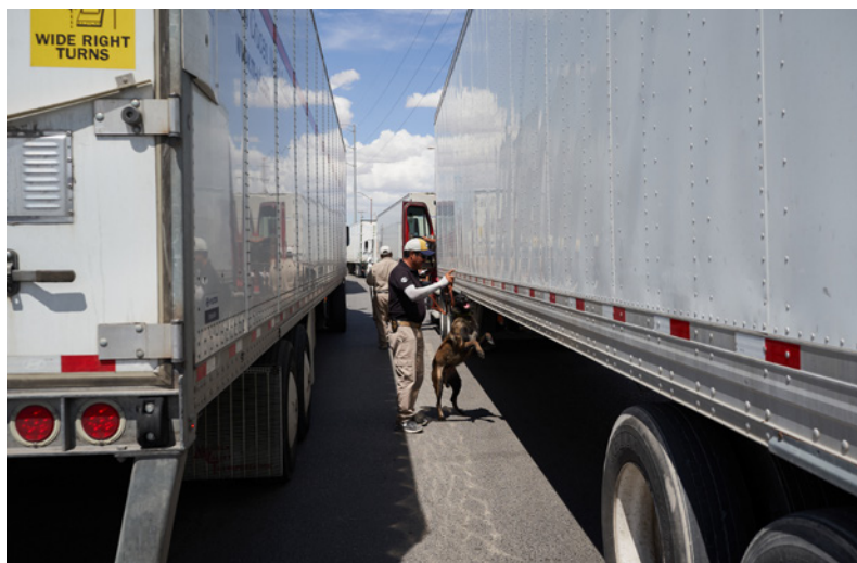
Un guardia de seguridad inspecciona camiones en la frontera entre Estados Unidos y México, un importante punto de convergencia de las rutas del narcotráfico y la migración irregular.

al aumento de la migración desde el Darién conformada por personas del Triángulo Norte y otras partes del mundo, como China, India y Pakistán. 242