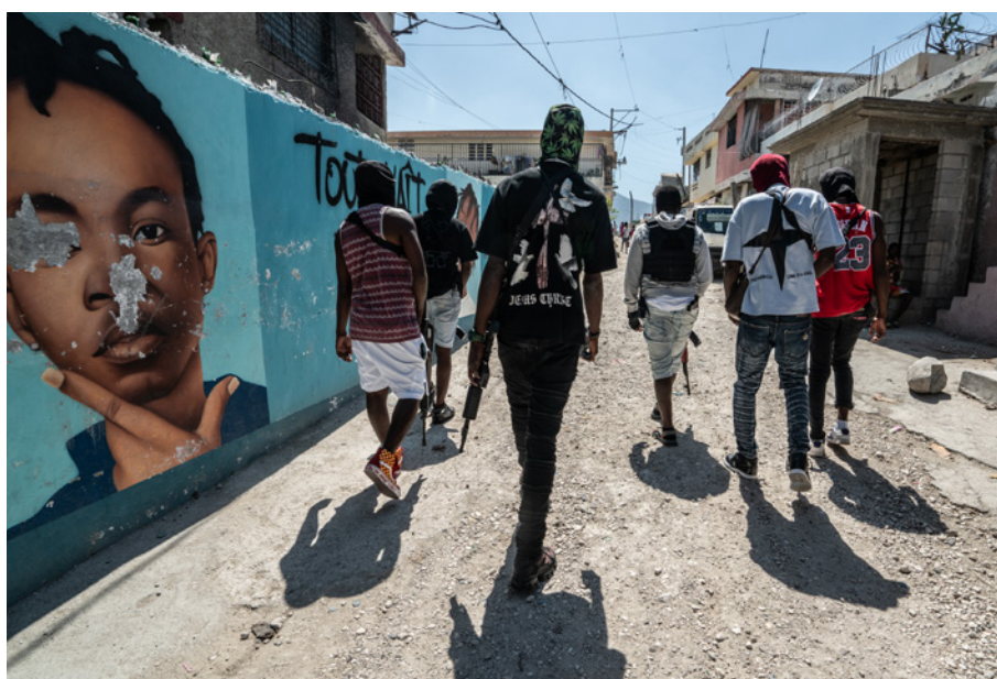
Bandas armadas patrullan las calles de Puerto Príncipe, Haití. En la actualidad, controlan alrededor del 85 % de la capital y han desplazado efectivamente a las instituciones estatales, generando un contexto de casi total anarquía.

Un rasgo característico del contexto latinoamericano es la tendencia de los grupos criminales de asumir el control territorial y las funciones gubernamentales, en particular en zonas fronterizas donde el Estado carece de legitimidad, capacidad y recursos, y las comunidades viven sumidas en la pobreza y sin acceso a servicios esenciales. Esto es evidente en Colombia y en la triple frontera de la región de la Amazonía, entre Perú, Colombia y Brasil. 68 Este fenómeno se ve exacerbado en las regiones donde las comunidades dependen de economías informales o ilegales para su supervivencia.