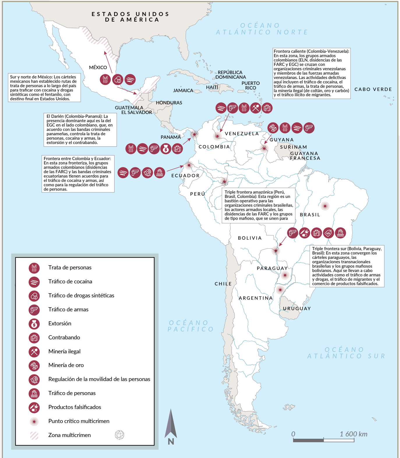
FIGURA 7 Puntos críticos del multicrimen en Latinoamérica.

Asimismo, el CV es un actor de gobernanza muy importante en Manaos. El grupo es la principal autoridad política en los barrios periféricos densamente poblados de dicha ciudad. Allí, el CV ha establecido alianzas electorales, permitiendo que los candidatos desarrollen sus campañas políticas en territorios controlados por el CV a cambio de la ejecución de proyectos de infraestructura y vivienda. 219