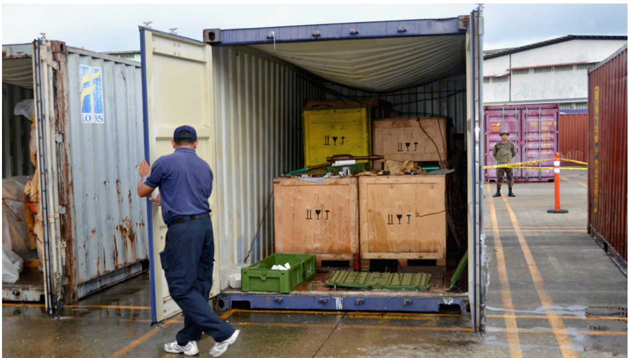
Un arsenal de armas confiscado en Colón, Panamá. Los puertos marítimos de América Latina presentan elevados niveles de corrupción y cumplen una función clave en la habilitación de flujos financieros ilícitos.

La proliferación de zonas económicas especiales (ZEE) dificulta la fiscalización aún más. Las ZEE conceden exenciones tributarias y regulatorias, pero también se han convertido en puntos críticos para la subfacturación comercial, falsificación y lavado de dinero basado en el comercio. 200 Según la Organización para la Cooperación y el Desarrollo Económicos, la creación de cada ZEE nueva se correlaciona con un aumento importante en las exportaciones de productos falsificados, en particular desde Latinoamérica. 201 Muchas ZEE, como aquellas en Paraguay y Panamá, también están directamente vinculadas al lavado de oro de mercado negro, un bien fundamental en el panorama regional de los FFI. 202