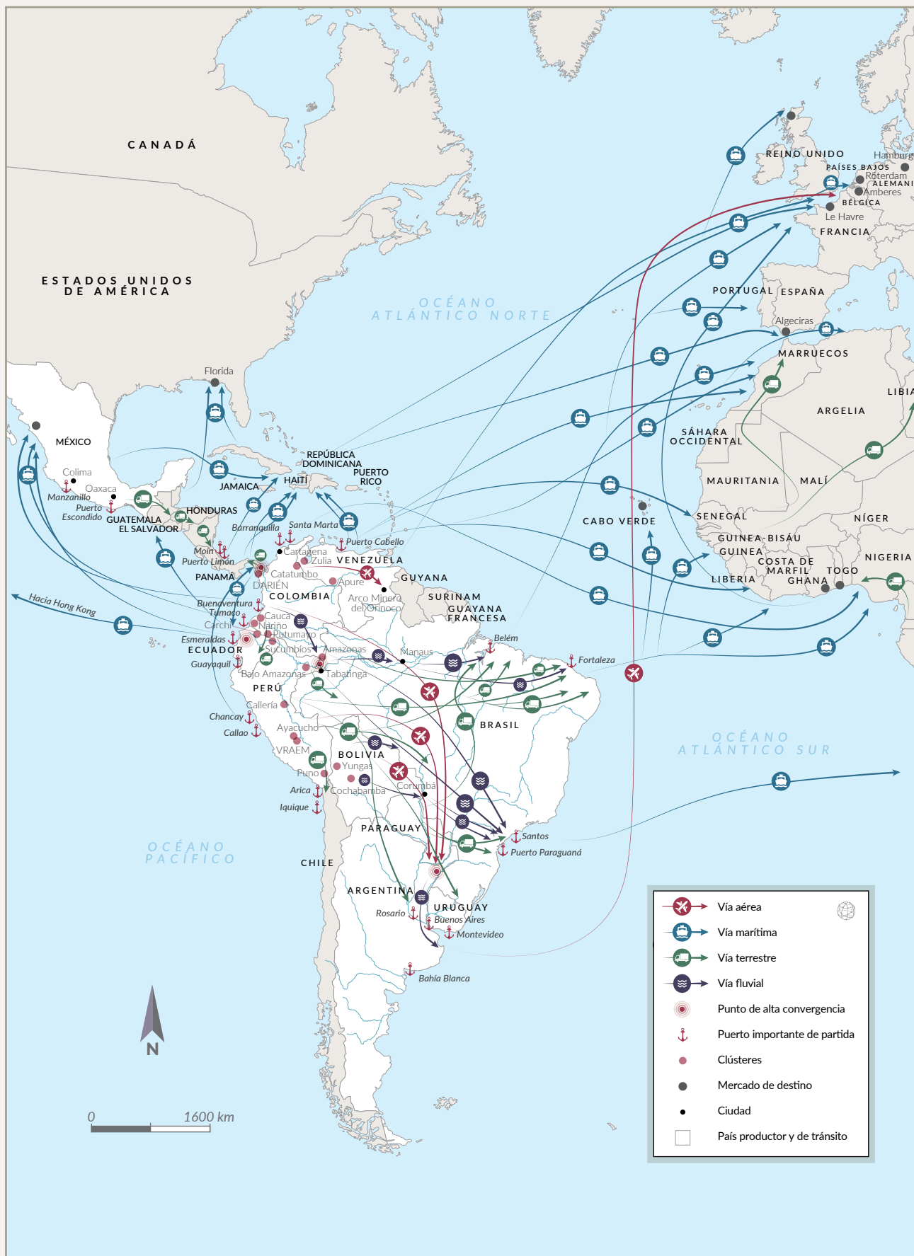
FIGURA 4 Flujos de la cocaína en Latinoamérica