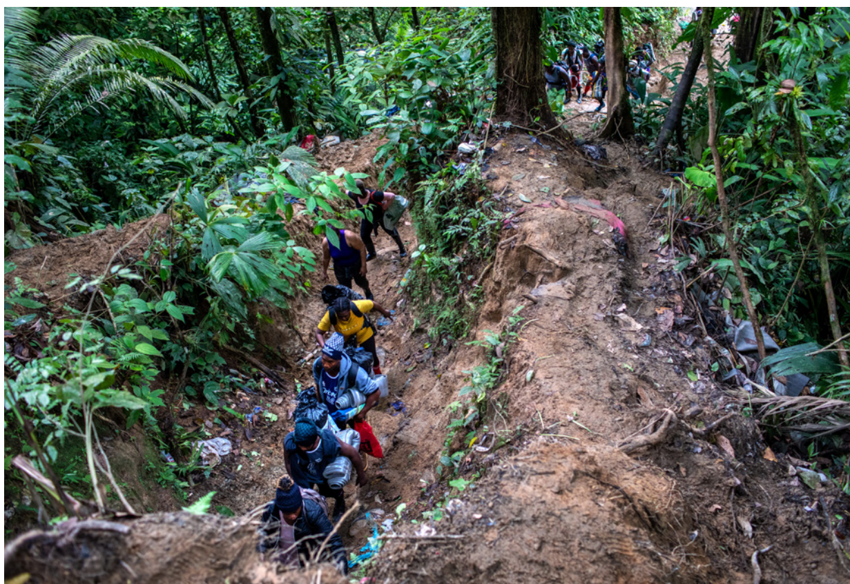
Los migrantes que atraviesan el Darién hacia Estados Unidos, uno de los corredores migratorios más peligrosos del mundo, a menudo sufren extorsión por parte de grupos criminales.

El Darién es un punto crítico. Esta peligrosa selva, situada entre Panamá y Colombia, funciona como punto de tránsito para los migrantes que buscan llegar a Estados Unidos o Canadá. En estas zonas, las pandillas panameñas, los grupos criminales dentro de la Policía fronteriza panameña y el EGC están profundamente involucrados en la trata de personas y drogas. 154