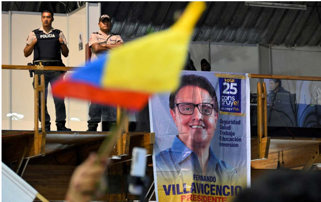
Agentes de la Policía hacen guardia mientras simpatizantes del aspirante presidencial asesinado, Fernando Villavicencio, rinden sus respetos.

Sus palabras resultaron clarividentes. El 3 de enero de 2024, días antes de que estallara el actual episodio de violencia, Salazar dijo que una banda criminal, Los Lobos (la misma que se cree que está detrás del asesinato de Villavicencio), estaba intentando acabar con su vida. 11 El 7 de enero, alias Fito, capo de Los Choneros, se fugó de una prisión de máxima seguridad donde cumplía una condena de 34 años. 12 Simultáneamente, estallaron seis motines en cárceles de todo el país y, más tarde, Fabricio Colón Pico, alias El Salvaje, líder de Los Lobos, se fugó de una prisión. 13