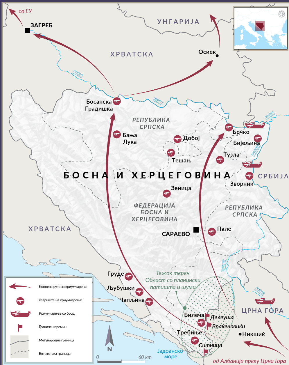
СЛИКА 1 Криумчарење оружје преку Босна и Херцеговина.

и кокаин на однапред договорени купувачи од Холандија во Хрватска и да криумчари и продава големи количини оружје од Босна и Херцеговина во Хрватска, а потоа во западноевропските земји. Полицијата заплени оружје и експлозиви на подрачјето на Славонски Брод и Окучани. 31