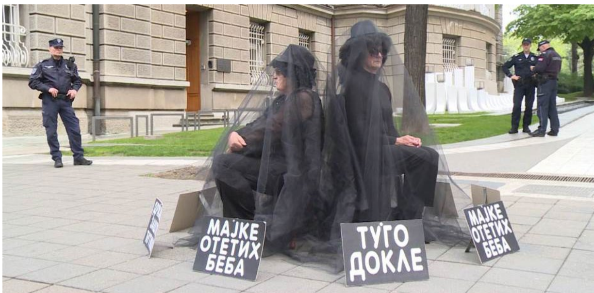
Протест во 2019 година во Србија за отфрлање на нерешените случаи на исчезнати бебиња.

Досега, вкупно 694 апликанти (претежно од Белград) поднесоа барања за започнување постапка за утврдување на судбината на новородените