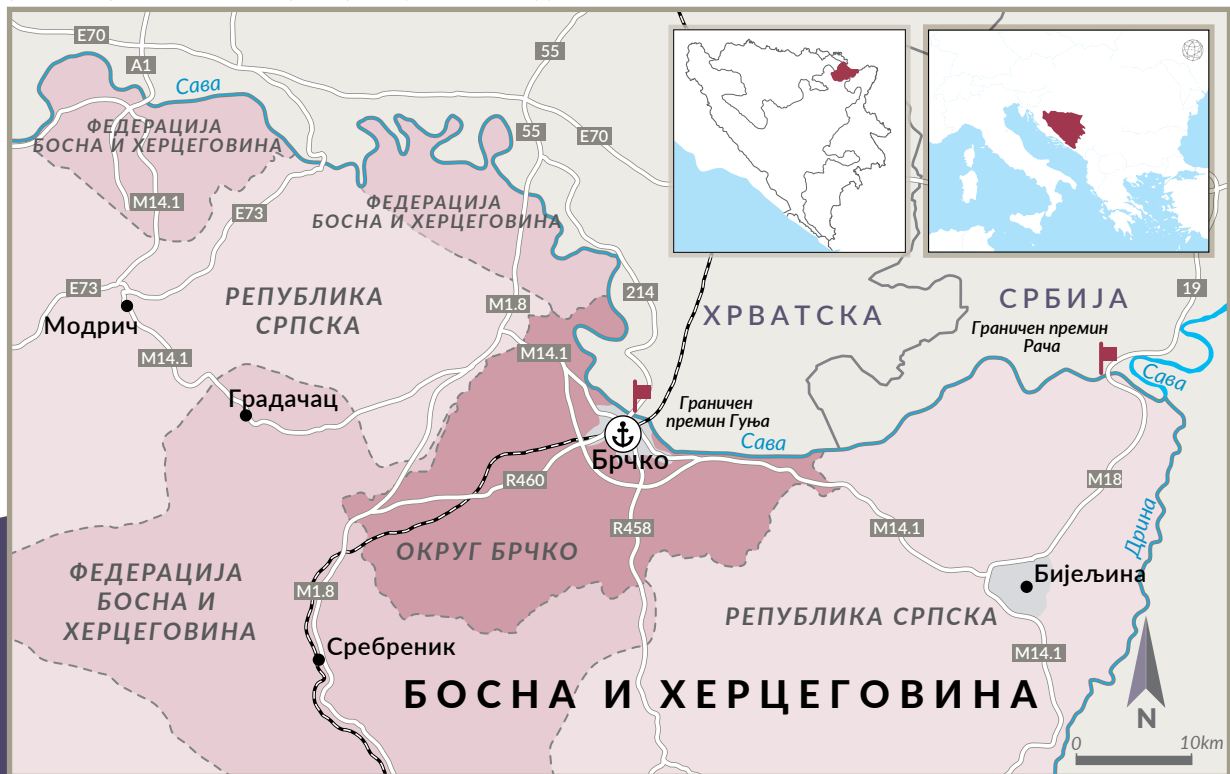
СЛИКА 2 Брчко, во Босна и Херцеговина, е клучен јазол за криумчарење во регионот.

Но, трансформирањето на црниот пазар за легални стоки во легален пазар не ги елиминираше нелегалните активности во областа. Криминалците бараа други можности, првенствено трговија со дрога и луѓе и криумчарење огнено оружје и стоки со висока царина.