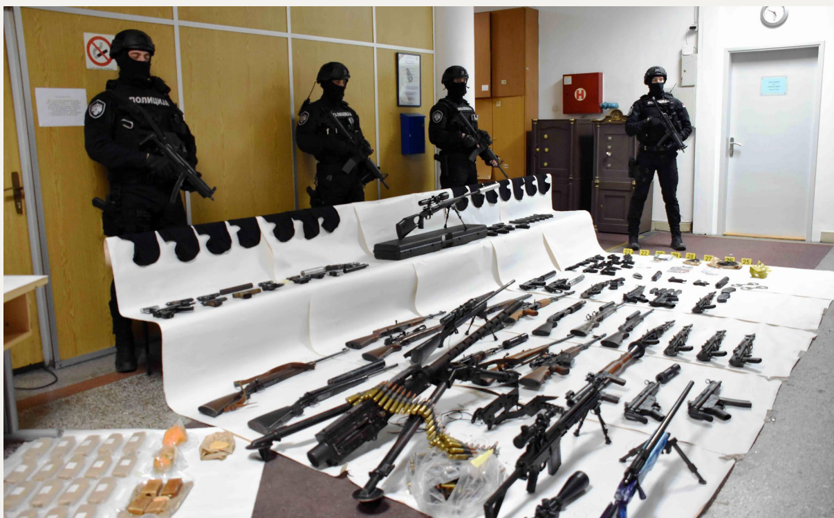
Оружје од криминалец и наводен дом на атентатор заплени во Ритопек, Србија.