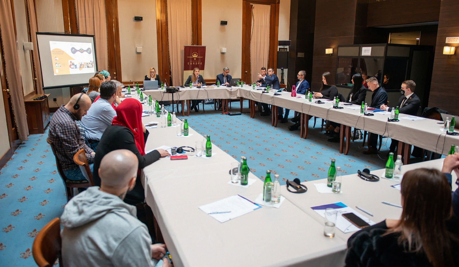
Diskutim në tryezë të rumbullakët gjatë dialogut për qëndrueshmërinë në Sarajevë të Bosnjës dhe Hercegovinës.

disa komunitete (kryesisht rurale) si dhe rinia. Pjesëmarrësit shkëmbyen edhe përvojat e tyre lidhur me ripërdorimin social të aseteve të konfiskuara nga grupet kriminale. Përfaqësuesit e OSHC-ve, kryesisht gra nga komunitetet jashtë kryeqytetit, diskutuan nevojën për kurajën civile dhe sfidat e ndërveprimit me qeverinë lokale, si dhe vështirësitë në shndërrimin e projekteve të financuara afatshkurta në nisma të qëndrueshme afatgjata.