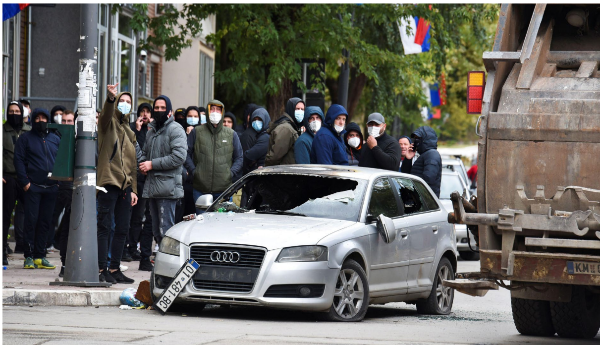
Automjet i dëmtuar pas përplasjes midis policisë dhe protestuesve lokalë gjatë operacionit kundër kontrabandimit të mallrave, Mitrovicë, 13 tetor 2021.