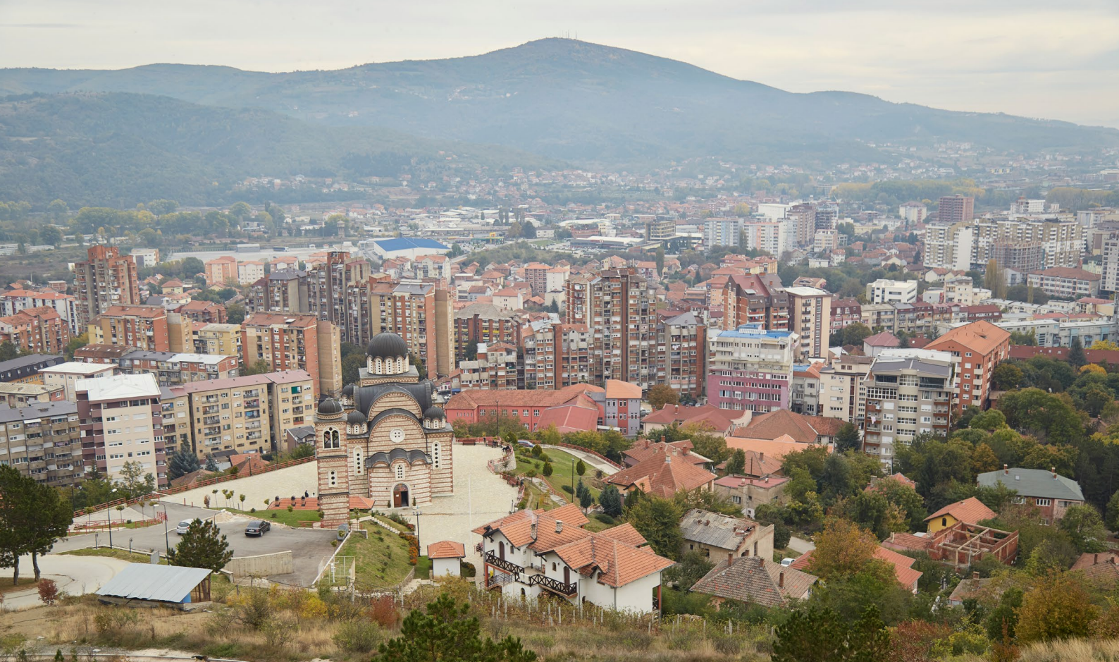
Pamje e Mitrovicës. Qyteti është i ndarë midis serbëve etnikë dhe shqiptarëve etnikë.

Statusi i kontestuar i rajonit dhe ekzistenca "de facto" e autoriteteve (që shpesh mbështeten nga Serbia), si dhe prania e strukturave paralele të sigurisë, ka bërë të mundur ekzistencën e një niveli të lartë vetëqeverisjeje "de facto". Kjo ka krijuar edhe një mjedis ku lejohen veprimtaritë e paligjshme për trafikantët serbë dhe shqiptarë. 5 Ky rajon është konsideruar edhe si vend i mirë fshehjeje për të arratisurit, për shembull, nga Serbia.