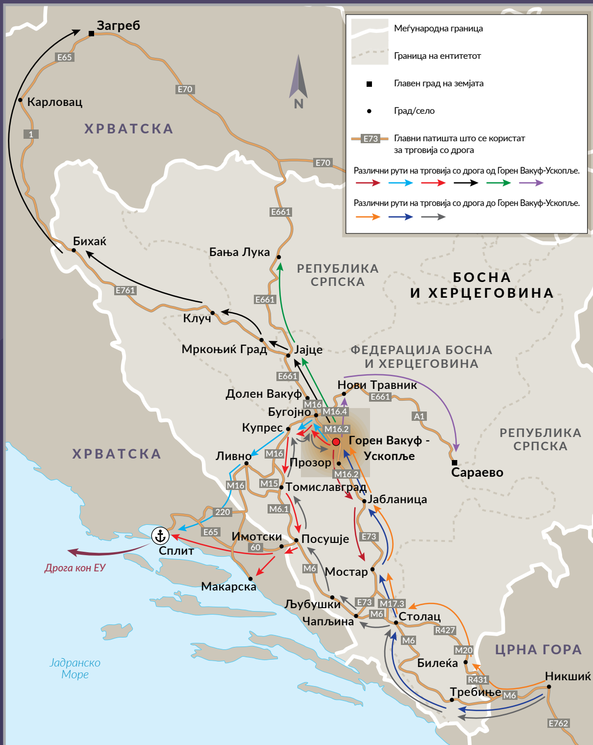
СЛИКА 1 Рути на трговија со дрога низ Горен Вакуф-Ускопље.