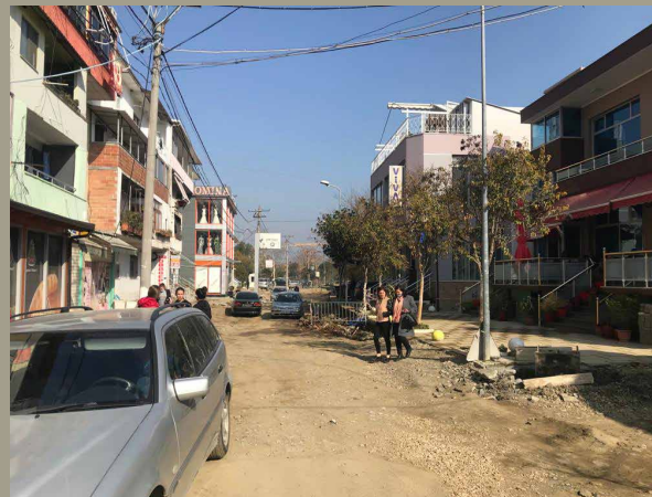
Курбин, град во Албанија, силно погоден од невработеност и насилство стана плодна почва за разбојниците.