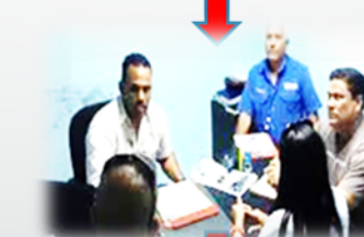
VIGILANTES ENTREGAN A DIRECTIVA