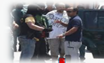
DIRECTIVA DESIGNA A VIGILANTES PARA EL COBRO