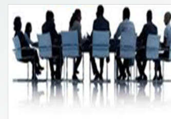
PANDILLA EXIGE A DIRECTIVA