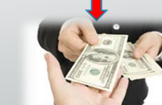
DIRECTIVA DISTRIBUYE EL DINERO